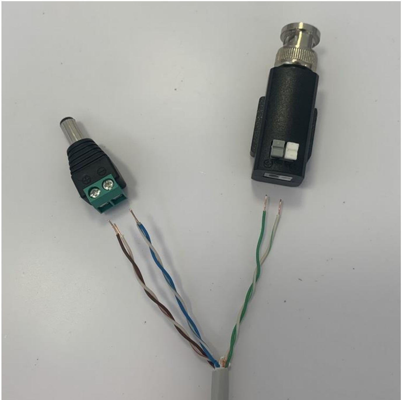
Utp kábel bekötése: