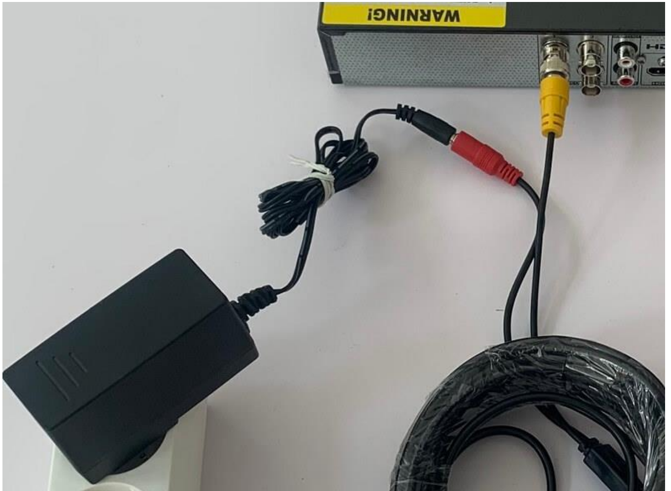
Kamera és kamerakábel csatlakoztatása: